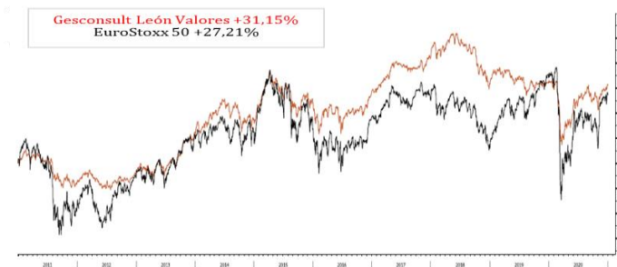
Datos a 31/12/2020.