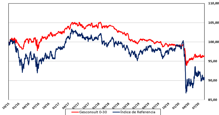
Datos a 31/08/2020.